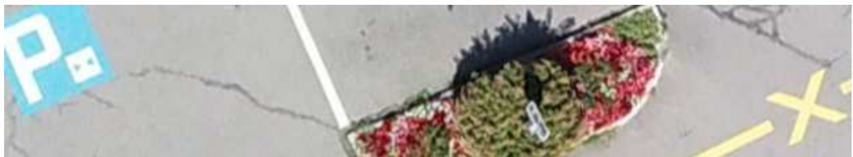
Detailansicht des Orthofotos mit einer Bodenpixelauflösung von 2cm.