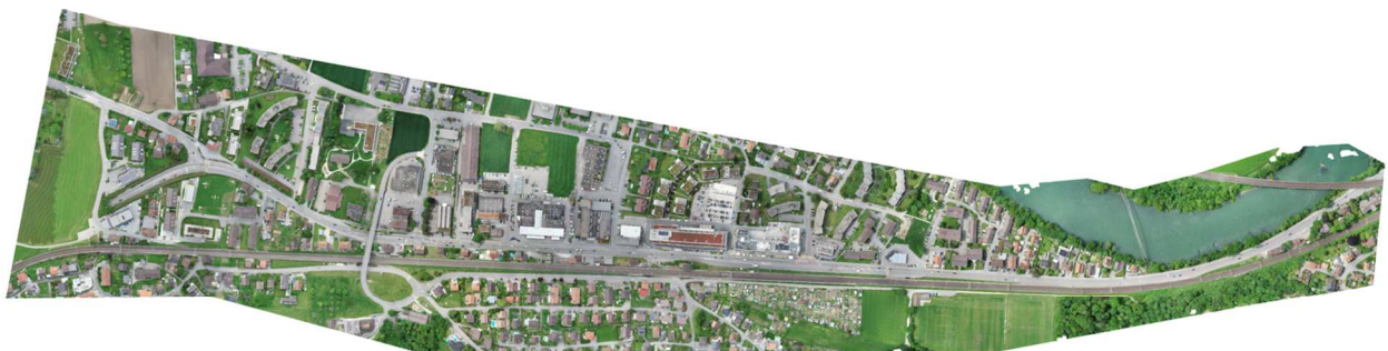
Aktuelles Orthofoto des gesamten Projektperimeters eines Strassenbauprojekts.

Ob Umgebungsplan, Grundlage für die Gestaltung einer Gartenanlage, Dokumentation von Baufortschritten, Bestandesaufnahme für ein Strassenbauprojekt oder Wettbewerbsgrundlage für eine Ortskernentwicklungsstudie: Mit unserem Orthofoto hebt Ihr Projekt ab!